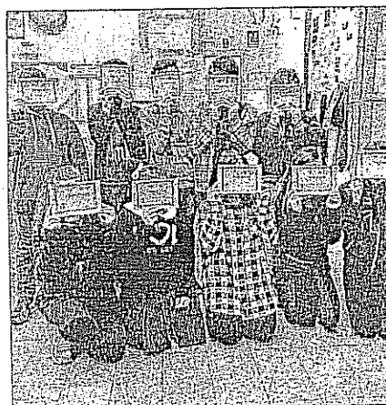
Piccoli scacchisti crescono A lezione prima del torneo vero e proprio